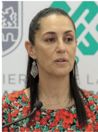
Claudia Sheinbaum Pardo