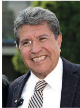
Ricardo Monreal Ávila