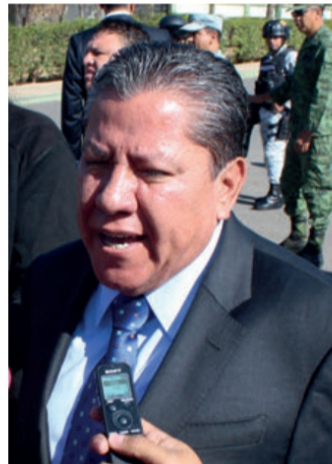
David Monreal Ávila

y su equipo de gobierno 'son incapaces para generar compromisos de crecimiento económico y de seguridad, que es lo que más lamenta la población, deberían de tener un poquito más de amor por Zacatecas y decir que es un estado que no merece lo que le está pasando en esos ámbitos'.