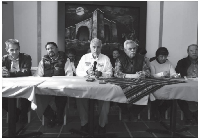
José Narro Céspedes forma parte de la Cuarta Transformación.

vido la masiva y permanente participación igualitaria de la mujer en la toma de decisiones en todos los ámbitos de la vida social y en el ejercicio de gobierno, además de hemos caminado a lado de ellas para erradicar de sus vidas cualquier tipo de violencia.