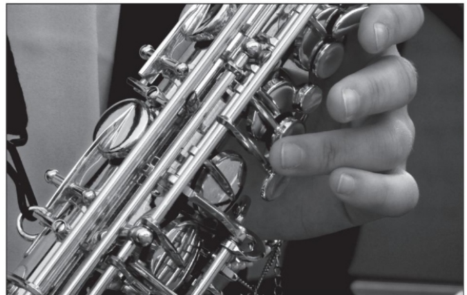
El blues es un género musical proveniente de la cultura afroamericana que ha logrado expandirse por el mundo.

Originarios de la calurosa Ciudad Valles en la huasteca potosina, con muchos discos, giras,