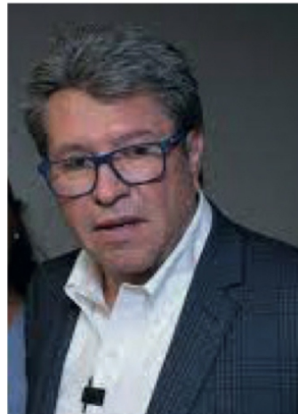
Ricardo Monreal Ávila

-AVER, deje veo: ... fueron 68 asesinatos en octubre, entre 31 días, el promedio es de 2.19 homicidios dolosos diarios en el último mes de Murillo; mientras que Valdivia lleva 11 en 5 días, su promedio es de 2.2 homicidios dolosos diario; o sea están en empate técnico, como se dice en las encuestas electorales-.