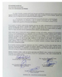
PIDEN A SECRETARIA respetar a todos los agremiados al SPAUAZ.

Las autoridades de la Oficina de Representación del Instituto de Seguridad y Servicios de los Trabajadores del Estado (Issste) Zacatecas, realizaron el pago de cuatro quincenas a personal de guardias y suplencias, por lo que levantaron el bloqueo en el Hospital General del Issste Zacatecas y regresaron a sus puestos. El monto para cubrir cuatro quincenas de adeudo fue por el orden de más de dos millones de pesos, mismos que fueron depositados en las cuentas de las y los trabajadores que laboran bajo esas modalidades de guardias y suplencias