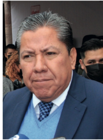
David Monreal Ávila