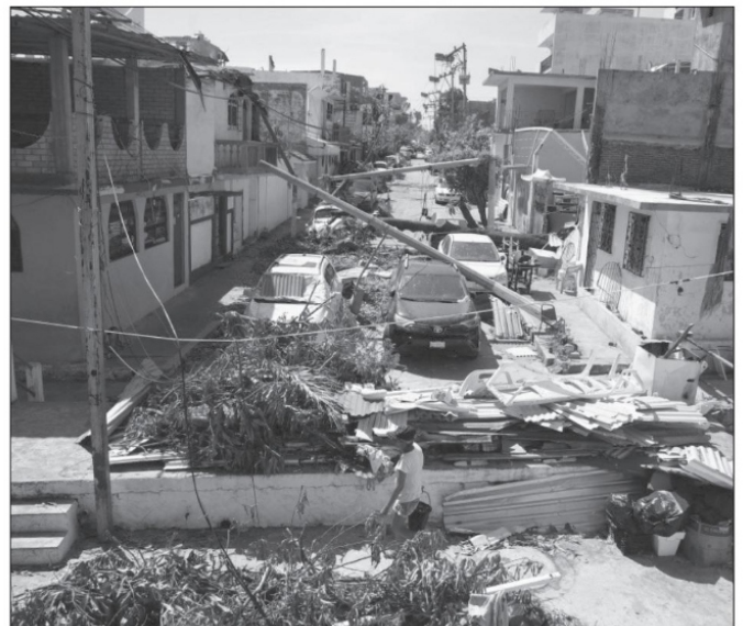
Acapulco, Guerrero, tras el paso del huracán Otis

La muerte danza seductora frente a los personajes y dentro de ellos para colocarnos en terreno de lo prohibido. Todo ante la descarnada negación que representa la muerte, que decía García Ponce. ■