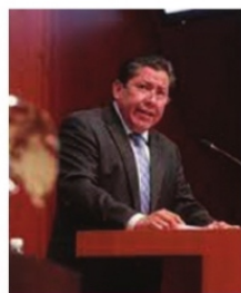
GOBERNADOR depurará la lista de aspirantes a Fiscalía.

Con el voto de los 27 diputados presentes, por unanimidad se acordó que esos cinco profesionales del Derecho