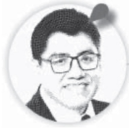
Saúl Monreal Ávila