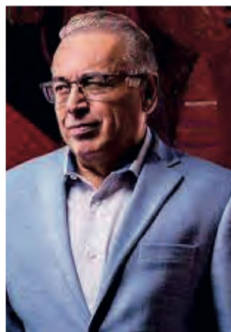
Arturo Nahle García