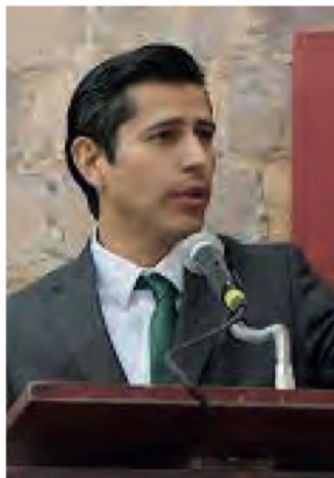
Julio César Chávez Padilla