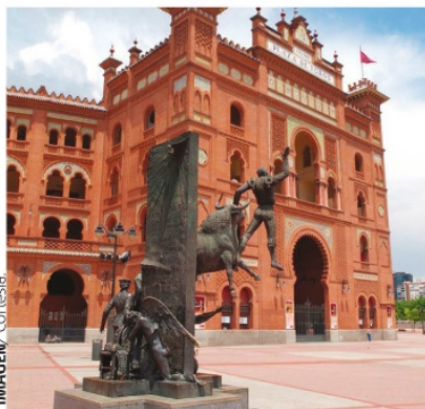
EN MADRID DESCUBRIRÁ EL MUNDO DE LA CAPITAL MUNDIAL DEL TORO, LAS VENTAS.

El turismo taurino en la Península Ibérica está tan desa-