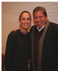
SE REUNEN, Monreal y sheinbaum.

Ayer se difundió el encuentro que sostuvieron Claudia Sheinbaum y David Monreal Ávila en donde acordaron seguir construyendo y consolidando la Cuarta Transformación, por lo que se ventiló que de esa reunión, ya vendrían los nombres de quienes finalmente serán los aspirantes al Senado de la República y con esto, seguramente sonarán los tonos de guerra en MORENA, el Partido del Trabajo y el Partido Verde. Aunque ya parece haber salida, no todo está terminado.