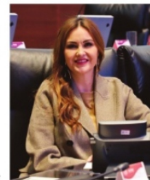
GEOVANNA BAÑUELOS sería la candidata de la coalición.

Todo apunta que en el tema del género mujer ya está decidida la selección en torno a la senadora petista Geovanna Bañuelos, quien sólo espera la decisión en el sector varonil, donde la inquietud es manifiesta y será esta misma tarde cuando se pueda despejar la duda. Mientras que los resultados de las encuestas para diputados federales, se conocerán hasta el 15 de enero próximo.