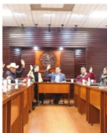
HOV se discutirá en el Pleno la aprobación del Paquete Económico 2024.

El Decreto de Presupuesto de Egresos para el Ejercicio Fiscal 2024, presenta algunos cambios que pueden ser muy significativos ya que, por ejemplo, en la propuesta del Ejecutivo, se contemplaban 446 millones 985 mil pesos para el Poder Legislativo, pero