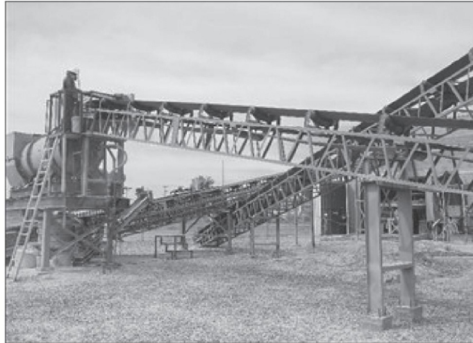
Proyecto de explotación de litio de Bacanora Lithium, en Sonora.