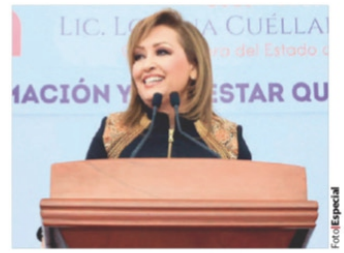
LORENA Cuéllar, en su Segundo Informe, ayer.

SUBRAYA gobernadora de Tlaxcala avance en 266 de 300 compromisos de campaña; asegura que cada día entregan una casa, un parque... pág. 9