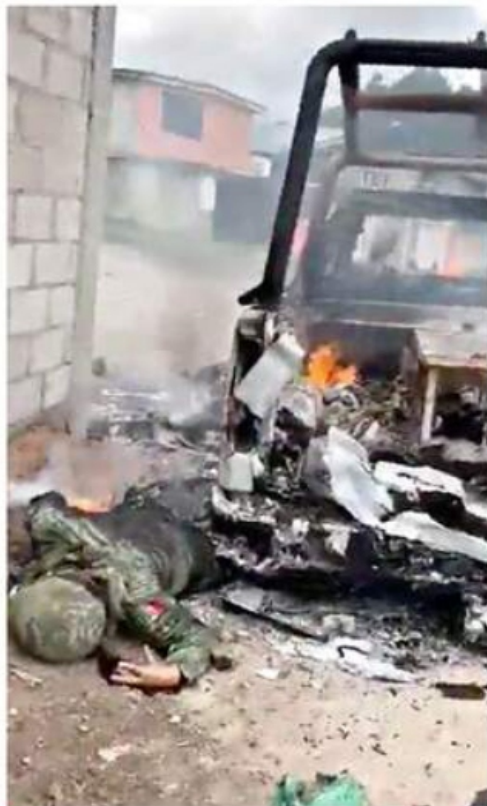
Algunos de los presuntos delincuentes, que vestían ropa tipo militar, fueron calcinados por los pobladores.

Todos los delincuentes fueron abatidos por los pobladores.