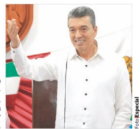
RUTILIO Escandón, ayer, en su 5° Informe.

DESTACA Rutilio Escandón en su Quinto Informe finanzas sanas e IED por 848 millones de dólares; también mejoras en educación y seguridad. pág. 8