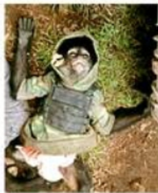
El año pasado, en un enfrentamiento en el mismo Municipio mexicano, murió un mono vestido de sicario.

Justicia del Estado de México. En el lugar también fue encontrado muerto un mono araña vestido de sicario.