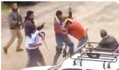
POBLADORES de Texcaltitlán, ayer, al chocar con un grupo criminal.