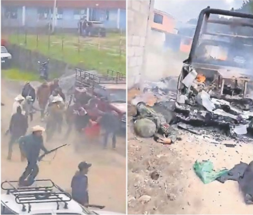
En videos difundidos en redes sociales se muestra cómo los pobladores encapsulan a machetazos y con rifles a los delincuentes, que estaban a bordo de camionetas, así como a las unidades y cuerpos calcinados.

ENTREVISTA BLANCA LILIA IBARRA CADENA Comisionada presidenta del Inai