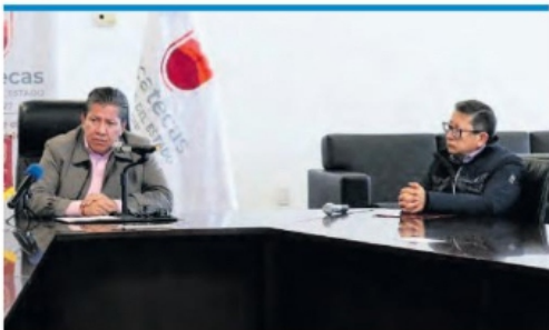
EL GOBERNADOR David Monreal anunció el apoyo.