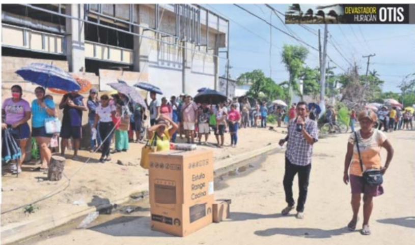
Bajo un intenso sol y desorganización, acapulqueños hacen largas filas para recibir electrodomésticos y colchones.