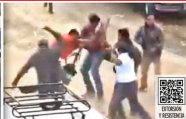
Tras ser citados en un campo de fútbol para pagar la extorsión, los agricultores de Texcapilla enfrentaron a los criminales.