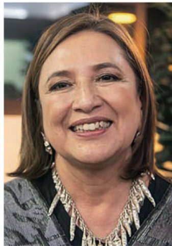
Xóchitl Gálvez Ruiz