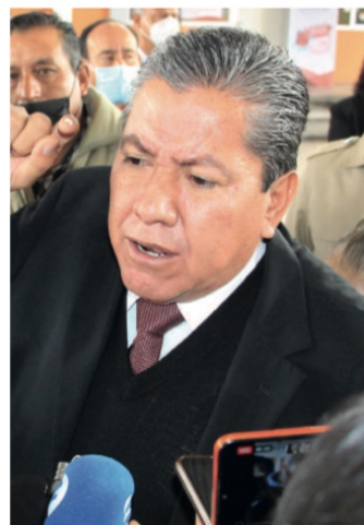
David Monreal Ávila