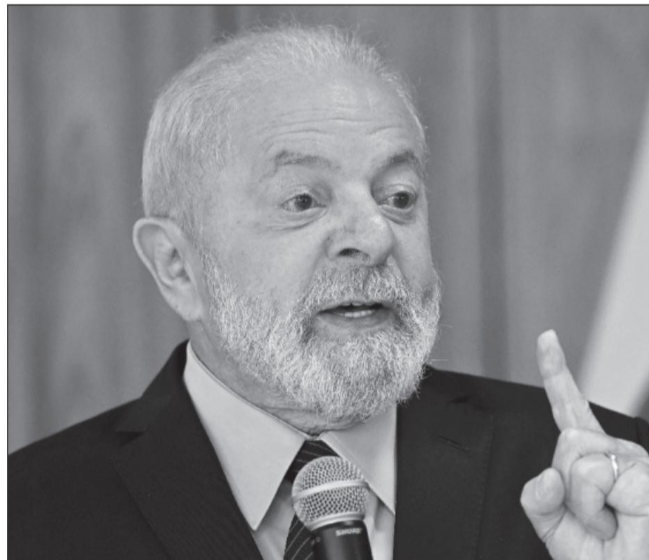
El presidente brasileño, Luiz Inácio Lula da Silva.

Crecimiento, y también contratos de compras por parte del gobierno.