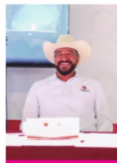
RODRIGO CASTAÑEDA , secretario de Economía.

La crisis económica ha condicionado el Estado de bienestar. Los elevados niveles de desempleo, la pobreza, la exclusión social y las políticas nacionales ponen en dificultades el Estado de bienestar como construcción política, social y económica, que promueve el secretario de economía Rodrigo Castañeda Miranda . Sus acciones de poco o nada sirven en la crisis que nos afecta. Una de las más severas expresiones de esta situación es el desempleo estructural, para cuya erradicación, las medidas de estímulo fiscal y las de "fomento del empleo" han mostrado su ineficacia.