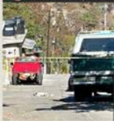
Un hombre fue ejecutado en un autolavado en la Colonia Vicente Guerrero.