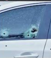
Los ocupantes de un auto fueron heridos en un ataque a balazos.