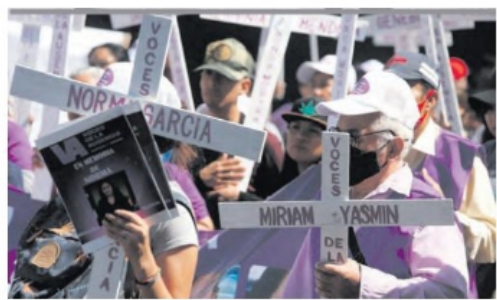
EL ESTADO ocupa el lugar 6 nacional por estos crímenes.