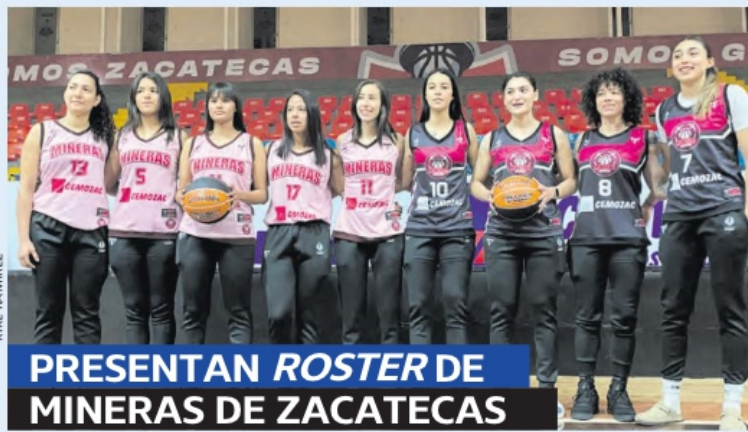
PRESENTAN ROSTER DE MINERAS DE ZACATECAS