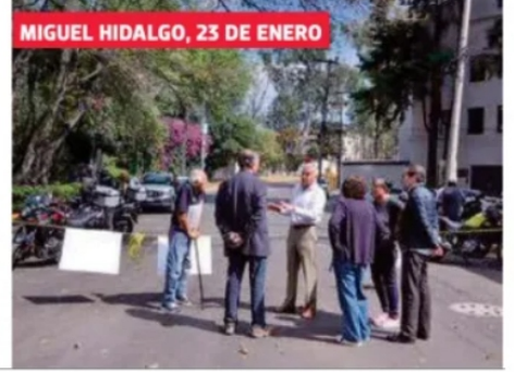
MIGUEL HIDALGO, 23 DE ENERO