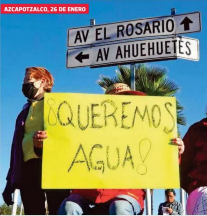
AZCAPOTZALCO, 26 DE ENERO