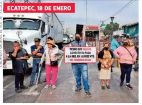
ECATEPEC, 18 DE ENERO