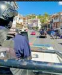
Fuerzas federales patrullan, tras extorsiones a transportistas y comerciantes.

del Gobierno estatal, por lo que iniciaron el programa "Yo te cuido" para dar confianza a los visitantes en la zona de antojitos.