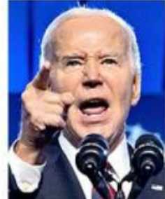
Biden lanzó el amago ayer.

Horas antes, el líder de la Cámara de Representantes, el republicano Mike Johnson, dijo que las negociaciones