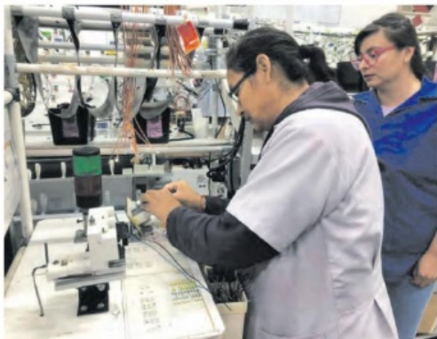
EMPLEADOS con 30 años de labores también fueron despedidos.

A puerta cerrada, a cada uno de los empleados les explicaron que la empresa