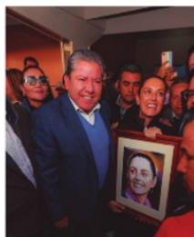
CLAUDIA SHEINBAUM , con el gobernador David Monreal.

Fue muy clara al señalar que "aun no se han definido candidaturas" e informó que todavía se tienen que revisar muchos perfiles, así que la incertidumbre crece y crece. Advirtió que no tiene preocupación por