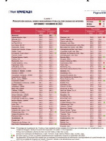
SEGÚN LA ENSU, Fresnillo continúa como la ciudad con mayor percepción de inseguridad del país.

Cuando se han desplegado una serie de recursos económicos y humanos a señalar que 2024 es el 'Año de la Paz' y que se han iniciado una serie de "estrategias" encaminadas a devolver la paz a las calles y la confianza entre la población, la realidad se impone y de nueva cuenta la percepción de inseguridad no