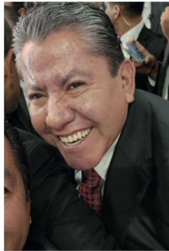
David Monreal Ávila