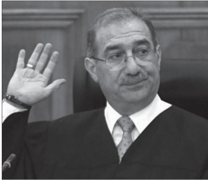
El ministro Alberto Pérez Dayán.

presidenciales en el 2018, lo económico estuvo ausente. Todos estaban de acuerdo con la autonomía del banco central, con la austeridad fiscal y los tratados de libre comercio. La discusión de lo económico debe acontecer en el 2024, considerando el nulo crecimiento de los últimos cinco años (de 0.6% promedio anual), como el alto nivel de empleo informal y la creciente dependencia de la entrada de capitales en que ha caído la economía mexicana que