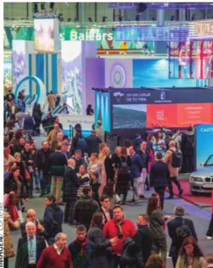
FERIA INTERNACIONAL DE TURISMO (FITUR) evento que se celebra anualmente en la ciudad de Madrid, España.

Hago el comentario porque en otra nota leí el tamaño de deuda que nos dejará la administración de Don Andrés por el capricho absurdo de la cancelación del NAIM misma que existirá hasta el año 2047 quedando pendientes de pago mil 158 millones de dólares por bonos de ese proyecto. Con simple matemática y sin ser un analista podemos darnos cuenta de todo el dinero que se