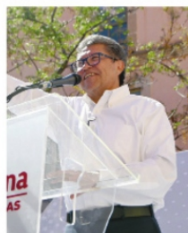
RICARDO MONREAL, ahora será diputado.