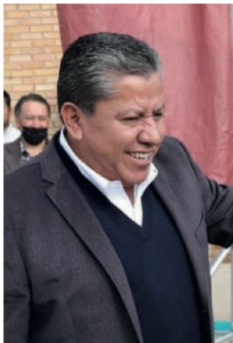
David Monreal Ocampo