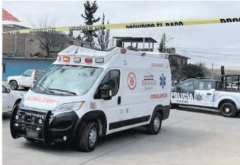
LO ATACARON a balazos en Plateros.