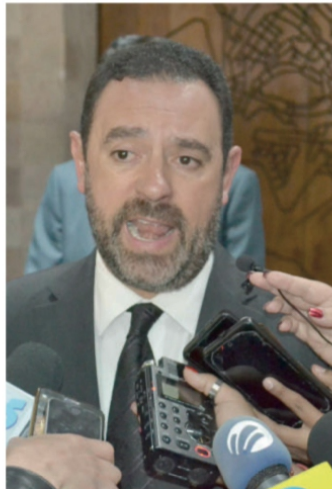
Alejandro Tello Cristerna