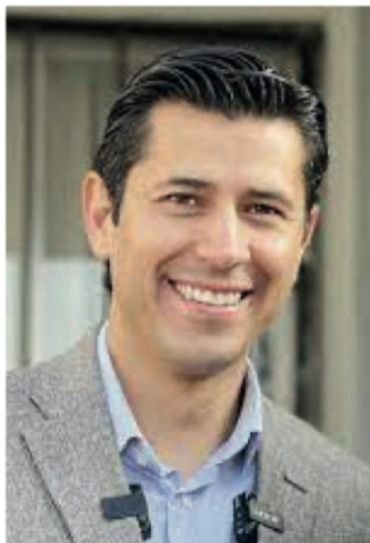
Julio César Chávez Padilla