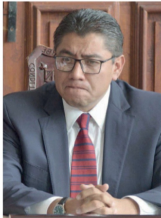
Saúl Monreal Ávila