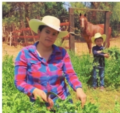
EN ZACATECAS, PERSISTE LA DESIGUALDAD mujeres rurales no registran ingresos.

Eso parece sugerir el porcentaje de divorcios solicitados por las mujeres de la entidad, de los cuales el 78.4 corresponden a solicitudes por abandono de hogar, mientras que la cifra correspondiente en el nivel nacional es de 78%. Cabe señalar que del total de demandas realizadas por mujeres, 0.7% corresponde a injurias, y violencia familiar, cifra más baja que la observada a nivel nacional (1.6%). En la entidad, todas las demandas de este tipo son hechas por mujeres y resueltas a su favor.