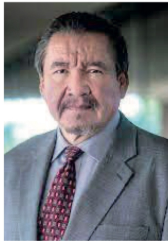
Rodolfo Monreal Ávila