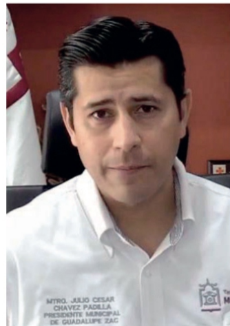
Julio César Chávez Padilla