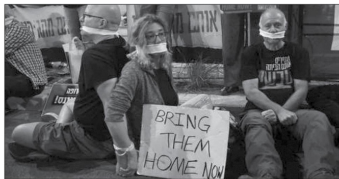
Netanyahu practica el “síndrome Masada” mil 951 años después, ante el aplastante clamor de la conciencia universal humanista de pueblos y países.

de genocidio dantesco, conminó a Israel a facilitar con carácter “urgente (sic)” la entrada de la “ayuda humanitaria (sic)” a la franja de Gaza ( https://bbc.in/3PDwakD ), bloqueada por cielo, mar y tierra, donde cunde la guerra alimentaria con las subsecuentes hambruna, sed y enfermedades.