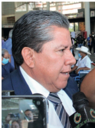
David Monreal Ávila