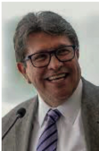
Ricardo Monreal Ávila