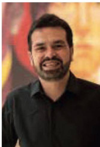
Jorge Álvarez Máynez