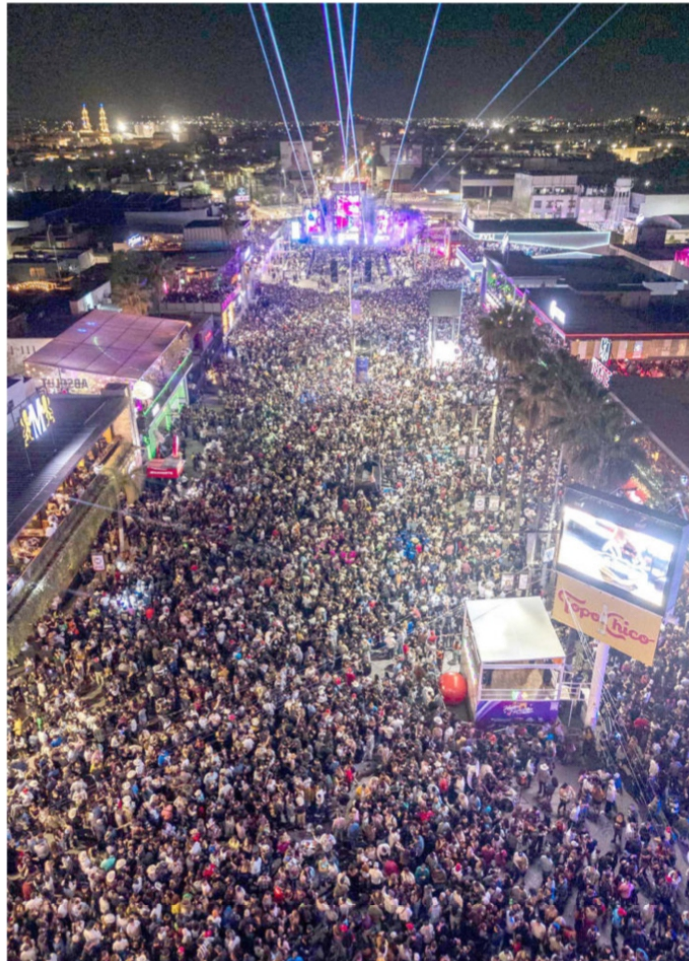
Un mar de gente en Aguascalientes