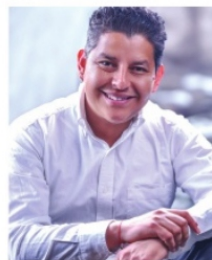
MARIO CÓRDOVA podría perder la candidatura.

candidatura la presidencia municipal puede caérsele de las manos. Él busca la reelección a la alcaldía de Río Grande, municipio que ya gobierna por el Partido de la Revolución Democrática, sin embargo, ahora renunció y se fue a los brazos del PRI. Está a punto de perder el registro porque fue impugnado por que no puede buscar reelegirse por un partido distinto al que lo impulsó en el primer proceso.