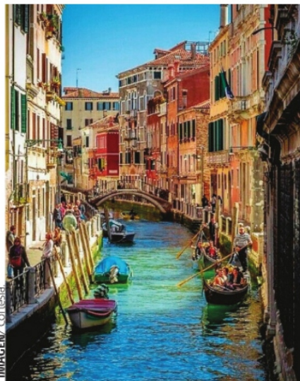
LA CIUDAD DE VENECIA EN ITALIA es la primera en implantar un dispositivo de cobro como si fuese parque temático.

A)Amsterdam. Si bien la capital de Países Bajos debería de conocerse por su arquitectura, historia e innovación; a nivel mundial se le reconoce como sinónimo de un lugar donde el mal comportamiento suele reinar ya que los excesos de los turistas forman parte de su diario vivir. Los Neerlandeses aspiran a que esos días estén de salida ya que desde el año pasado las campañas publicitarias sobre los