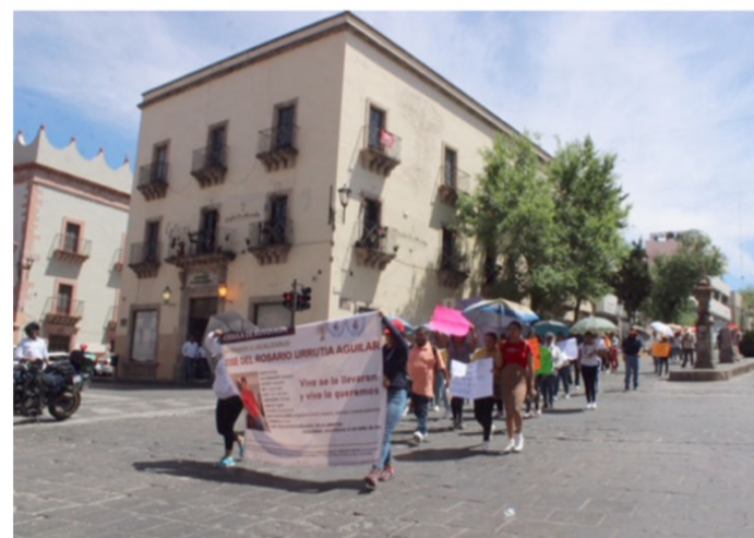
“¡Vivo se lo llevaron, vivo lo queremos!”