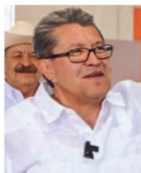
RICARDO MONREAL , senador y hermano de "El cachorro"