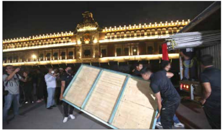
▲ Anoche, los familiares montaron el campamento.

E. OLIVARES, A. URRUTIA, J. LAURELES, C. GÓMEZ Y S. OCAMPO / P 9