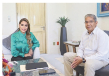
LA GOBERNADORA del estado y el Fiscal general, durante la reunión, ayer.

ADVIERTEN en UNAM desafíos que pondrán en riesgo supervivencia; alta vulnerabilidad en zonas agrícolas; peligro de desplazamiento de personas. pág. 8