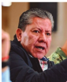
DAVID MONREAL se comprometió con los familiares de desaparecidos.

Familiares de personas desaparecidas o no localizados en Fresnillo, centro de atención del problema que se ha agudizado en los últimos tiempos, fueron escuchados por el gobernador del estado, David Monreal Ávila , quien dio cuenta de las diversas acciones operativas