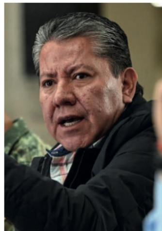
David Monreal Avila