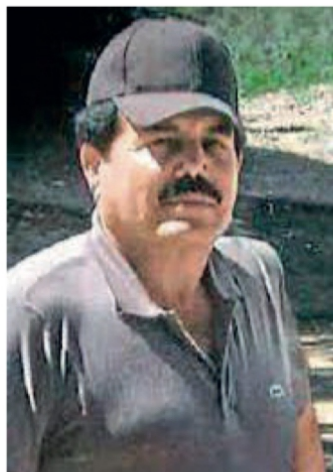
Ismael 'El Mayo' Zambada García