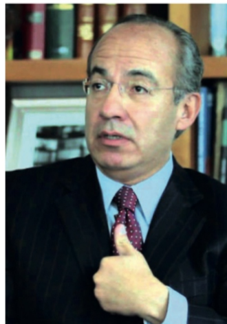
Felipe Calderón Hinojosa