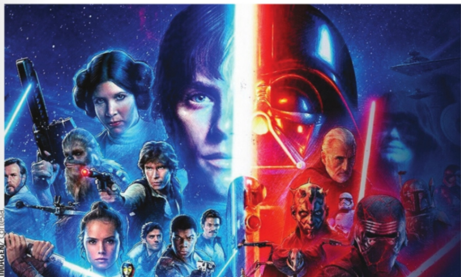
EL 4 DE MAYO, desde hace algunos años se le dedica a la película de George Lucas, Star Wars o Guerra de las Galaxias.

Disfrute el fin de semana, salga, diviértase y consuma local. Que la fuerza lo acompañe, hasta la próxima.