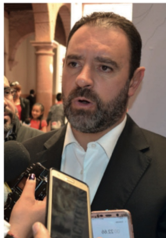
Alejandro Tello Cristerna

-YO CREO que el Aparicio está pedorro, lo que necesitan es más dedicación y amor a su trabajo, además de echarle más honestidad y huevos al asunto: son miles los policías, guardias nacionales y soldados del Ejército Mexicano, que luchan contra el narco y lo único que están haciendo es podar el árbol de la inseguridad que luego vuelve a reverdecer con más fuerza, por la descarada impunidad-.