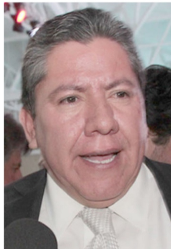
David Monreal Ávila