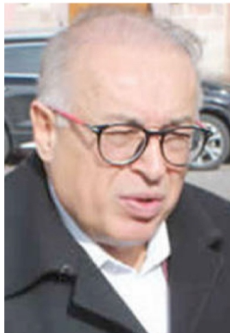
Arturo Nahle García