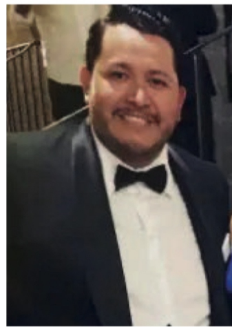
Ricardo Monreal Pérez

‘ EL INMUEBLE en comento, data del año 1915 y por sus características arquitectónicas como su diseño, estructura y fachada, forma parte del catálogo de inmuebles con valor artístico del Instituto