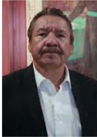
Rodolfo Monreal Ávila

GENERAL PRIM 72: NEGOCIO INMOBILIARIO Y HOTELERO