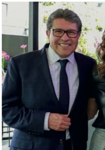
Ricardo Monreal Ávila