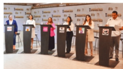
SE DIERON CON TODO en el debate.