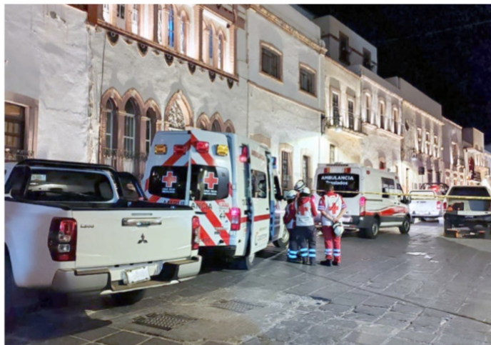
Dos asesinatos en conocido bar del Centro Histórico de Zacatecas

se traen ganas, que se vayan al semidesierto y que ahí se agarren a fregadazos, pero ya dejen al pueblo trabajar y divertirse, porque al rato van a cerrar todos los bares, antros y tugurios y, la verdad, los zacatecanos no somos borrachos de buró, nos gusta chupar entre amigos, para cotorrear el punto, jugar dominó, y los que están chavos les gusta bailar y ligar, entonces si van a comenzar otra vez a matar parroquianos, ya valió Bertha, Xóchitl-.