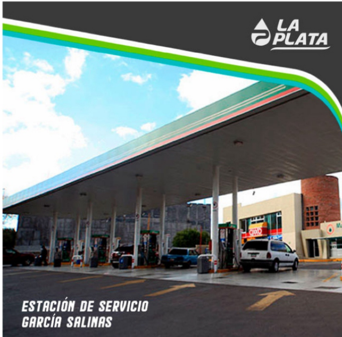
Grupo Plata y tráfico de influencias