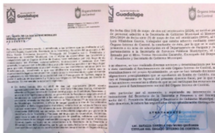
LA CONTRALORA NOTIFICÓ A LA SÍNDICA, la obstaculización de su labor.

Sin respuesta, la síndica llevó a la sesión de cabildo la decisión de separar del cargo a la titular del órgano interno de control, y en la sesión del pasado martes, el Cabildo en pleno relevó de sus funciones a la titular del Órgano Interno de Control, y en el apartado de los Asuntos Generales, se dio lectura al dictamen en el cual se solicitó el relevo de la funcionaria, mismo que fue aprobado por mayoría calificada al obtener 10 votos a favor, 2 en contra y 0 abstenciones de los miembros del cabildo presentes.