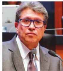
RICARDO MONREAL , senador zacatecano.