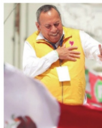
JESÚS ZAMBRANO visitará Zacatecas.

Lo que sí está seguro, es que antes de hacer un recorrido por cuatro municipios, el ex dirigente de la Liga Comunista 23 de Septiembre, estará en la capital en una conferencia donde aprovechará para levantar la mano del candidato a la alcaldía de la capital Miguel Varela Pinedo , con lo que se cumple el compromiso que en tres días distintos, estén en Zacatecas los dirigentes nacional de los tres partidos de la coalición "Fuerza y Corazón por México". Después de su adhesión y apoyo al candidato capitalino, Jesús Zambrano ira a Jerez a reunirse con la estructura del partido del pueblo mágico, donde según sus números, el aspirante a la alcaldía por el sol azteca, Rodrigo Ureño Bañuelos, puede dar una sonora sorpresa. De Jerez, Zambrano ira a Valparaíso, Fresnillo y Saín Alto.