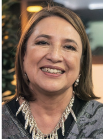
Xóchitl Gálvez Ruiz

-YO YA agarré barco, o mejor dicho barca, una de mis marchantes vino muy sácale punta y me apostó mil pesos a la “La Gelatina” va a ganar la Presidencia de México; no pues de inmediato se los acepté, así es que el domingo 2 de junio con esos mil pesos vamos a celebrar la victoria de la Dra. Sheinbaum, con unas carnitas y unas cervecitas, jajaja... de que las hay, las hay”.