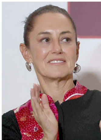
Claudia Sheinbaum Pardo

El Gobierno de México, da a conocer, lo que el gobierno de David Monreal nos esconde a los zacatecanos