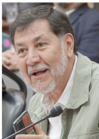
Gerardo Fernández Noroña