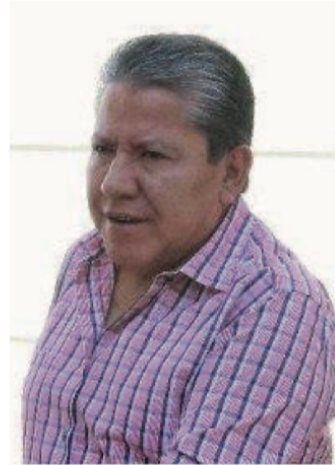
David Monreal Ávila