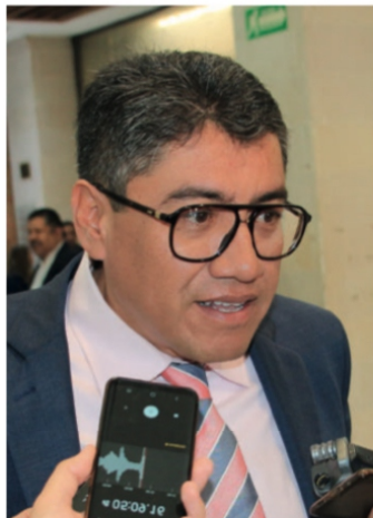
Saúl Monreal Ávila