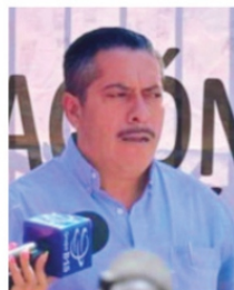
SINDICATO RECRIMINA falta de atención.

Debido a la falta de aire acondicionado, al menos 20 cirugías fueron postergadas en el Hospital General de Zacatecas "Luz González Cosío", y no es por que haga mucho calor, sino que ese insumo sirve como un auxiliar, ya que evita la proliferación bacteriana y disminuye los riesgos de infección, por lo que el personal del área de cirugía decidió postergar las cirugías programadas por la falta de respuesta de la Secretaría de Salud para atender la emergencia. Otra vez la Secretaría de Salud.