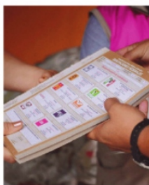
LA UNIÓN ES NECESARIA, independiente de lo político.

Una vez que estén electas las nuevas autoridades locales y federales, la necesidad social y económica de la entidad se harán presentes y con urgencia en el actuar, quizás convocar a un pacto de unidad y desarrollo económico de todas las partes sea necesario, independientemente de la inclinación política.