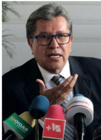
Ricardo Monreal Ávila