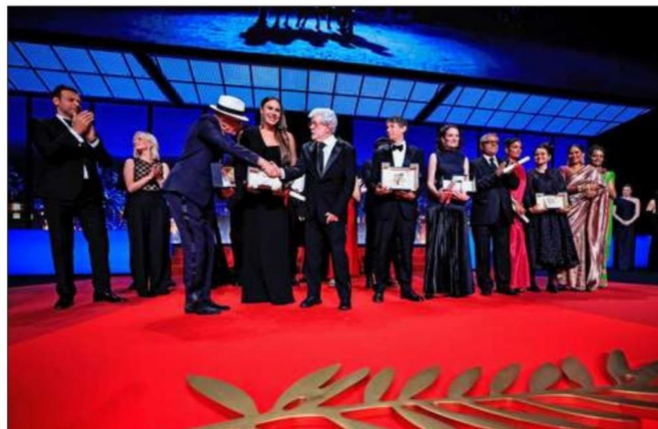
Los galardonados en el escenario durante la ceremonia de clausura de la 77 edición del Festival de Cine de Cannes.

principal: Zoe Saldana, Karla Sofía Gascón, Selena Gómez y Adriana Paz, quien pasa a las estadísticas como la primera actriz mexicana en ser reconocida así en Cannes. El otro fue el Premio del Jurado, que es como de consolación.