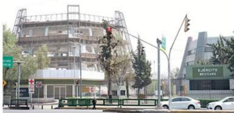
Los trabajos en la Colonia Irrigación iniciaron desde el pasado 10 de abril.

"Al centralizar las operaciones en un solo lugar, se logra una significativa reducción en costos de mantenimiento y operación", justifica.