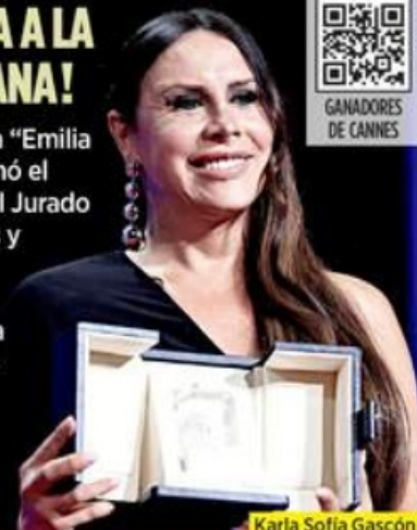
Karla Sofia Gascon