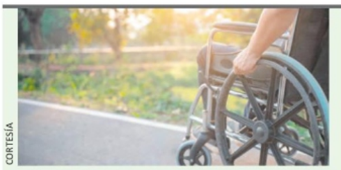
EN ZACATECAS, 79 mil 748 hombres se encuentran en esta condición.

PROCESO CUMPLEN PARIDAD, PESE A RENUNCIAS DE CANDIDATAS NUESTRA COMUNIDAD A3