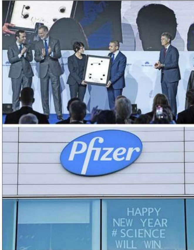
En España, el rey Felipe VI entregó la semana pasada el premio Cercle d'Economia a los cofundadores de BioNTech, Ugur Sahin y Özlem Türeci, empresa que desarrolló, junto con Pfizer, la primera vacuna contra el covid-19 aprobada en Europa.

WINNIE BYANYIMA Y JOSEPH E. STIGLITZ* ESPECIAL PARA LA JORNADA