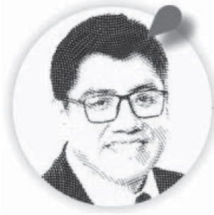
Saúl Monreal Ávila