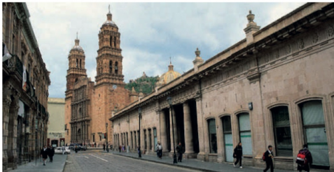
El turismo brilla por su ausencia

de primera, bien se lo dijo el ‘Monreis’ en aquella llamada telefónica.