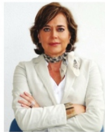
ROSAURA RUIZ, sería la secretaria de Educación Pública.

Rosaura Ruiz es una bióloga, catedrática, investigadora y académica mexicana que obtuvo el doctorado en 2001, y se ha especializado en la investigación de las teorías evolutivas desde las perspectivas científica, histórica y filosófica, temas sobre los cuales ha publicado numerosos artículos en revistas de investigación y difusión a nivel nacional e internacional. Fue directora de la Facultad de Ciencias de la Universidad Nacional