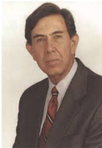
Cuauhtémoc Cárdenas Solórzano