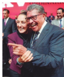
RICARDO MONREAL , coordinará la bancada de Morena en la Cámara de Diputados.

Razón por la que se perfila como el coordinador del grupo parlamentario de Morena, que tendrá mayoría y por tanto, le corresponderá presidir la Junta de Coordinación Política.