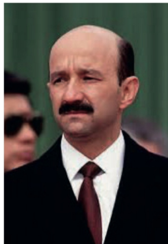
Carlos Salinas de Gortari