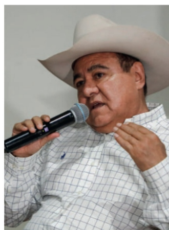
Le Roy Barragán Ocampo

estado, varios matones a sueldo armados hasta los dientes, asesinaron a balazos a dos hombres. No hay detenidos.