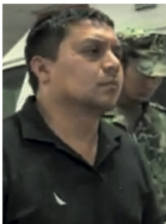
Miguel Ángel Treviño Morales