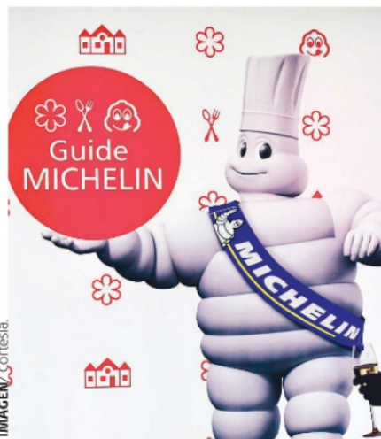
LA GUÍA MICHELIN ha catalogado a su muy particular estilo a los mejores restaurantes en territorio nacional mexicano.

Para que tenga idea de los parámetros en cuanto a las estrellas otorgadas por Michelin, le comento que nacen en 1920, se desarrollaron hasta 1930 y